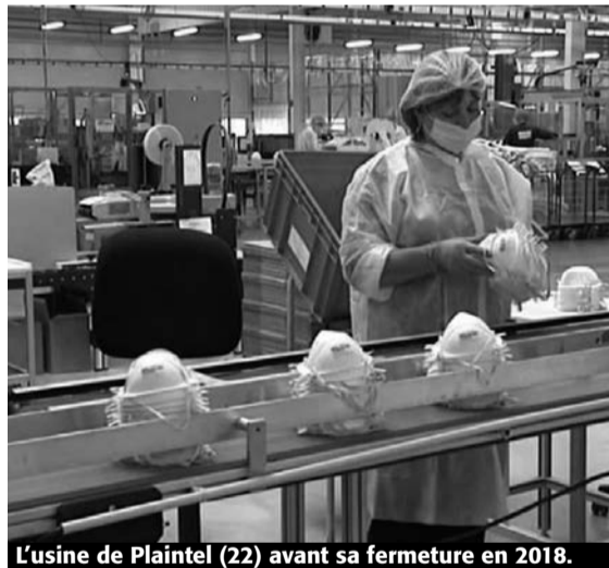
L'usine de Plaintel (22) avant sa fermeture en 2018.

Les salariés interpellent à l'époque le ministre de l'Économie, l'Élysée, qui se contentent de « prendre note ». Un conseiller du ministre Bruno Le Maire ajoute aujourd'hui aux journalistes de Radio France, comme pour se dédouaner, « ne pas avoir eu les moyens d'empêcher une fermeture d'usine dans un secteur qui n'était pas alors considéré comme stratégique » ! Plus encore, il pointe la responsabilité de l'État « qui a arrêté de stoc-