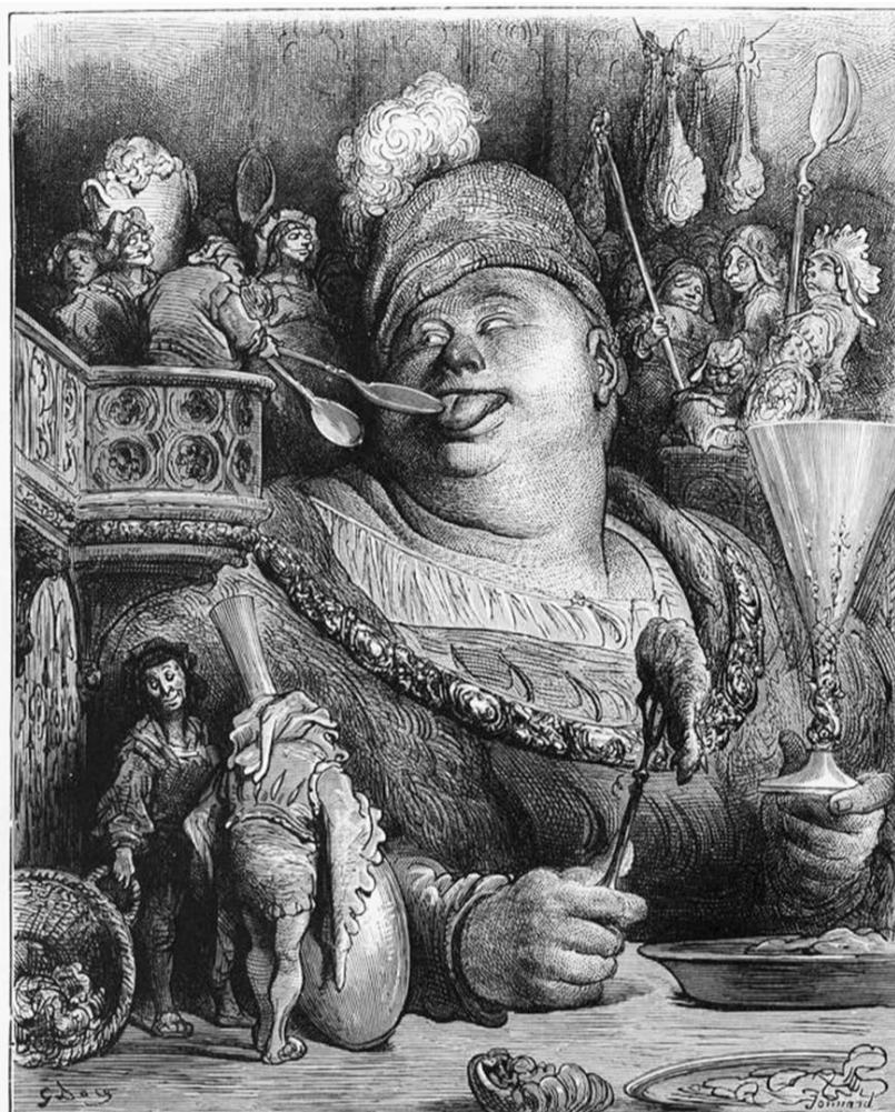
Le Repas de Gargantua, Gustave Doré, 1848, gravure.

Alors revenons plus près de nous et en France. En 1982, l'épidémie du Sida progresse de manière foudroyante. De nom-