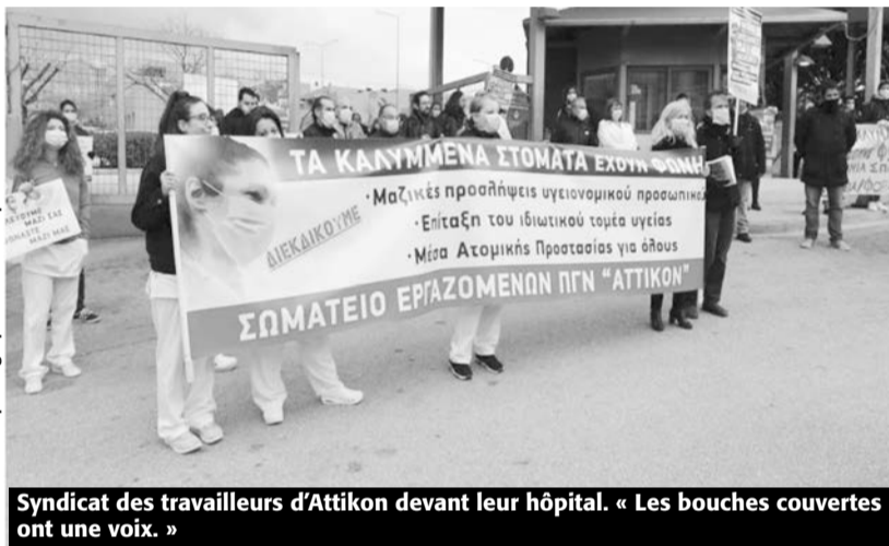
Syndicat des travailleurs d'Attikon devant leur hôpital. « Les bouches couvertes ont une voix. »