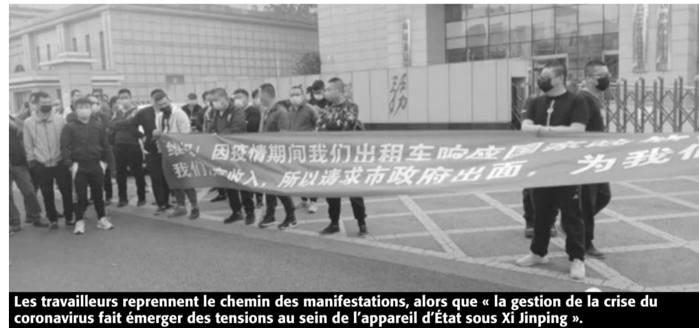
Les travailleurs reprennent le chemin des manifestations, alors que « la gestion de la crise du coronavirus fait émerger des tensions au sein de l'appareil d'État sous Xi Jinping ».

Pour la revue économique du PC chinois Caixin (30 mars), « la pandémie a porté un coup dur à une économie chinoise qui luttait déjà pour gérer les pressions à la baisse et l'affaiblissement du marché du travail. Les économistes prévoient largement que l'économie se contracte au premier trimestre, entraînant la croissance projetée du PIB pour 2020 à 4 %, voire moins. Sur la base des