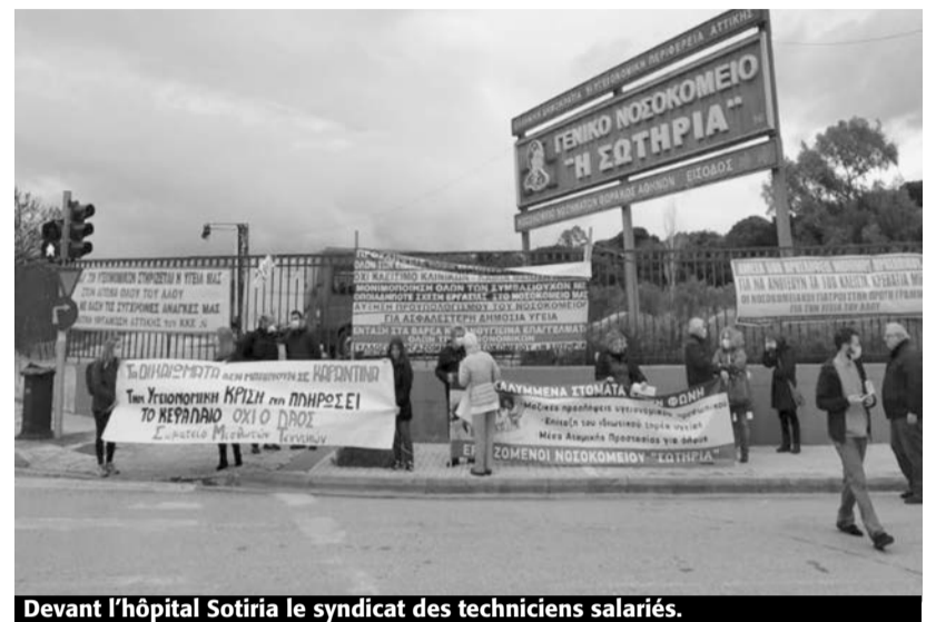
Devant l'hôpital Sotiria le syndicat des techniciens salariés.

Le 7 avril, à l'appel de l'Oenge et de syndicats de base, des centaines de militants, d'un bout à l'autre du pays, de l'Évro jusqu'en Crète, de Patras à Lesbos et dans de nombreux quartiers d'Athènes et de Salonique, ont organisé, sous différentes formes, des actions