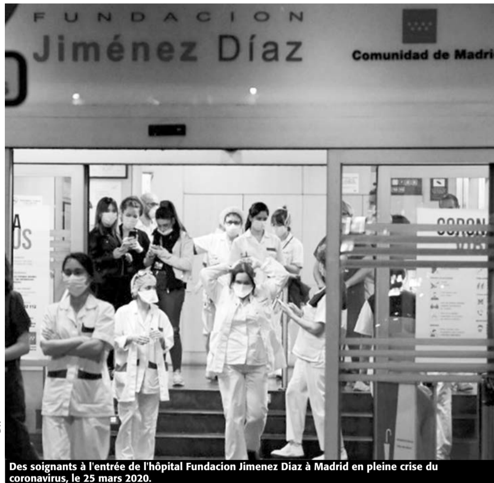
Des soignants à l'entrée de l'hôpital Fundación Jiménez Díaz à Madrid en pleine crise du coronavirus, le 25 mars 2020.