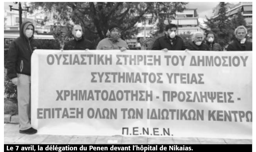
Le 7 avril, la délégation du Penen devant l'hôpital de Nikaïas.

devant les hôpitaux, les centres de soins, devant le ministère de la Santé par exemple, où le courant lutte de classe de l'UL d'Athènes : « Le droit du travail et la santé publique, au-dessus de leurs profits ! »