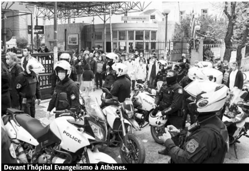
Devant l'hôpital Evangelismo à Athènes.