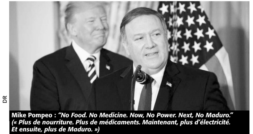
Mike Pompeo : « No Food. No Medicine. Now, No Power. Next, No Maduro. » (« Plus de nourriture. Plus de médicaments. Maintenant, plus d'électricité. Et ensuite, plus de Maduro. »)

Que l'annulation du paiement de la dette extérieure serve à combattre le coronavirus et la faim des travailleurs et du peuple ! ■